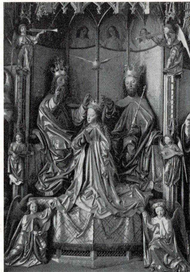
In der alten Pfarrkirche zu Gries, nahe beim Kloster, findet sich der berühmte Pacher-Altar (Werk des Michael Pacher von Bruneck). Auftraggeber waren im Jahre 1471 sieben wohlhabende Grieser Bauern. Das Altarwerk besitzt eine außerordentliche künstlerische Kraft, die den Beschauer unwiderstehlich in ihren Bann zieht.

Im Frühmittelalter waren vor allem die Anhöhen der Mittelgebirge, wie in der vorgeschichtlichen Zeit, stärker besiedelt, während